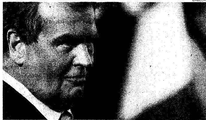
Il ministro della Semplificazione. Roberto Calderoli

Nessuna novità invece per il decreto attuativo su fisco regionale e costi standard sanitari. Per la terza volta consecutiva la conferenza unificata non ha dato il parere, complici i nodi ancora irrisolti sui tagli imposti dalla manovra estiva. Ma una schiarita sembra dietro l'angolo. Il presidente dei governatori, l'emiliano Vasco Errani, in serata ha dichiarato che un incontro con l'esecutivo dovrebbe svolgersi la prossima settimana. Sempre dall'unificata è giunta un'altra cattiva notizia per il governo: è stato rinviato il parere sulla lista dei beni demaniali esclusi dal processo di trasferimento agli enti locali. Ora toccherà al demanio apportare le modifiche volte a rendere più chiaro l'elenco.